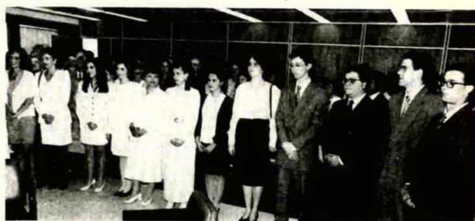
Posse oficializa o ingresso na carreira