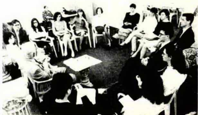
Os juízes passaram por um curso de preparação